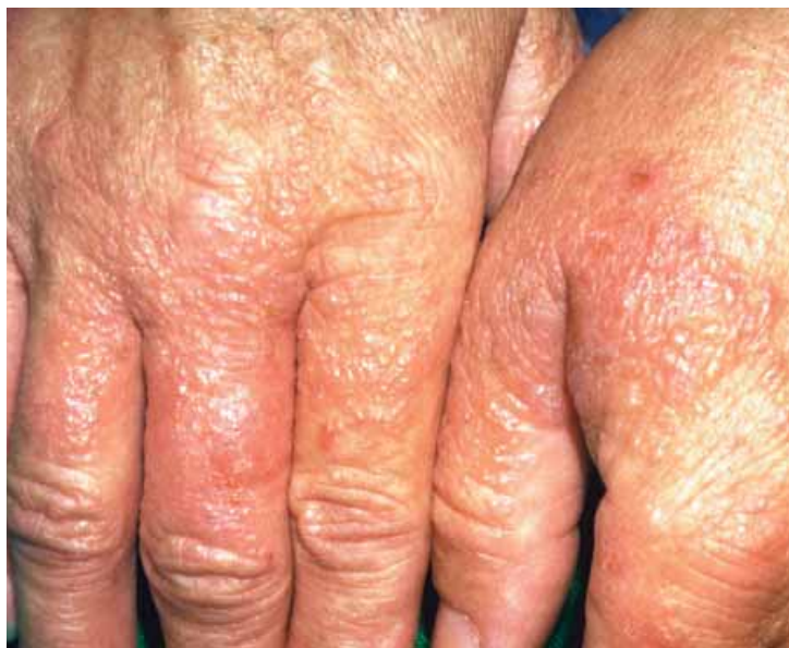
Eccemas de contacto alérgico en las manos debido a las alergias del tipo IV al Tiurano.

También se sospecha que el polvo que se utiliza en la producción para facilitar el calzado y mejorar la absorción del sudor provoca alergias del tipo I. Los resultados publicados sobre este tema siguen siendo contradictorios. Así, pruebas del almidón de maíz tomadas directamente del guante mostraron que el polvo está contaminado con alérgenos del Látex natural. Los mismos alérgenos no se podrían encontrar en el almidón de maíz