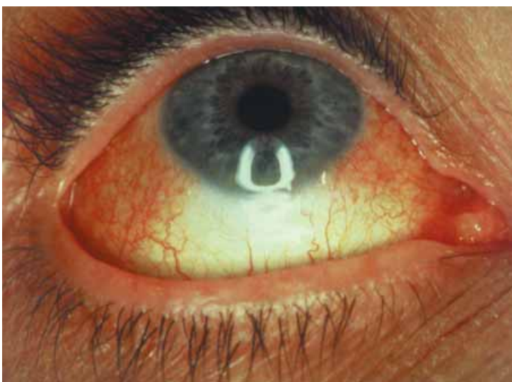
Conyuntivitis (Urticaria de contacto - síndrome estado III)

Los factores desencadenantes y los sensibilizantes principales son los aceleradores, antioxidantes y vulcanizantes utilizados en la producción moderna de guantes médicos, que por un lado han permitido optimizar la producción, pero por otro lado son la causa principal de alergias al Látex. Los aceleradores más peligrosos en la producción de guantes son los Tiuranos, los cuales en un 50 - 80 % de los casos son los responsables de tales alergias.