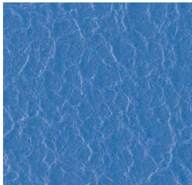
La struttura a rete del rivestimento interno: poco attrito => calzata facile

Il rivestimento interno, sintetico, che facilita la calzatura di Sempermed Supreme, è il risultato di anni di lavoro. La struttura del rivestimento è brevettata.