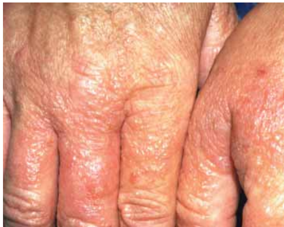
Allergisches Kontaktekzem der Hände bei Typ IV-Allergie gegen Thiurame

So zeigten Maisstärkepuder-Proben direkt vom Handschuh Kontaminationen mit Allergenen des Natural Rubber Latex (NRL). Die gleichen Allergene konnten im reinen Maisstärkepulver aber nicht nachwiesen werden. Daher wird vermutet, dass das Puder nur das Transportmedium der Latexproteine ist. Beim An- bzw. Ausziehen der Handschuhe wird staubförmiges Puder freigesetzt, das so die Allergene in die Raumluft transportiert. Das würde auch erklären, warum überempfindliche Personen, die selber nicht direkt mit Latexmaterialien in Kontakt kommen, in stark belasteten Krankenhausräumen unter